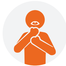
呼吸急促或呼吸困难