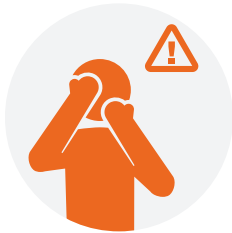
触摸带有病毒的物体或表面，然后触 摸您的嘴，鼻子或眼睛。