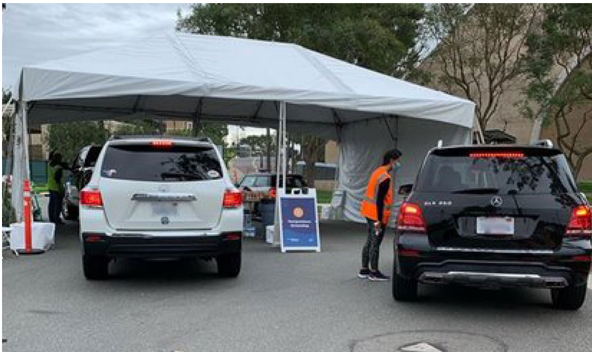
Hình: Chích ngừa tại xe nay đã sẵn sàng phục vụ người khuyết tật hội đủ điều kiện và có hẹn với địa điểm chích ngừa Super POD ở Đại học Soka.