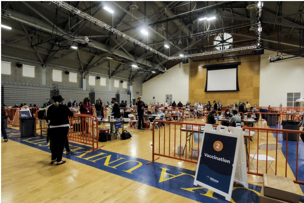
FOTO: Se realizan vacunaciones en el más reciente Super POD del Condado de Orange en la Universidad Soka.