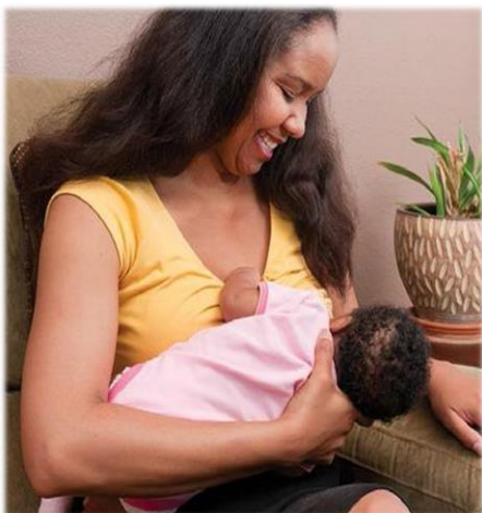
Tư Thế Nâng Đỡ