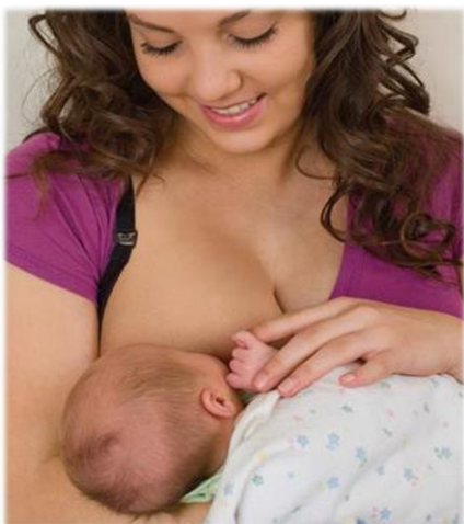
Tư Thế Ấp Ủ