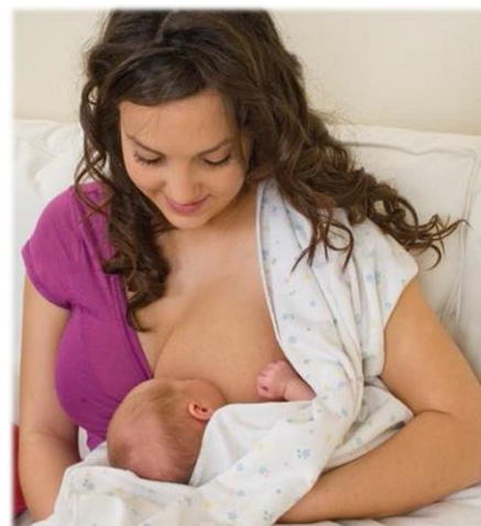
Tư Thế Cầu Thủ Ôm Banh