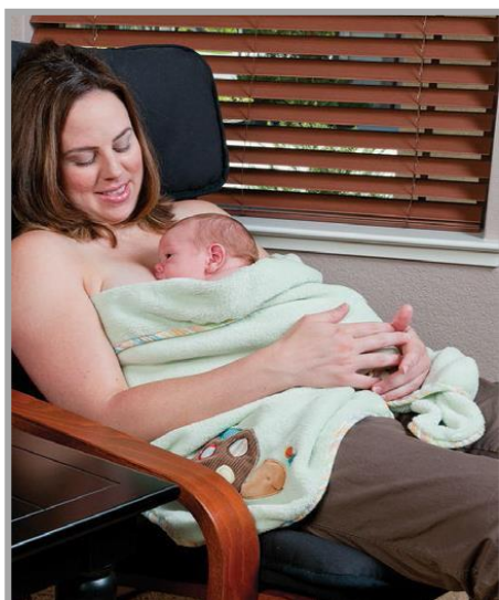
Tư Thế Nằm Ngã